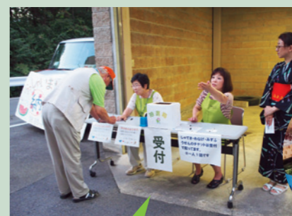
イベントでのお手伝い