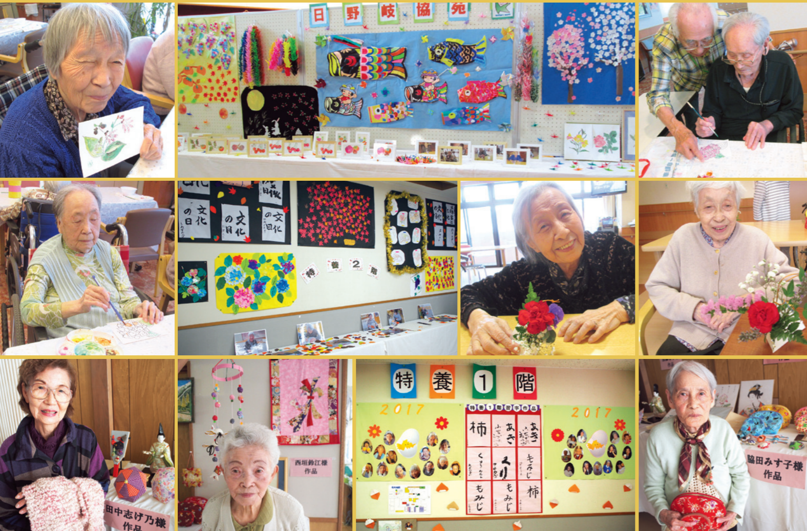
岐協苑文化祭 作品一覧(製作者の皆さん)