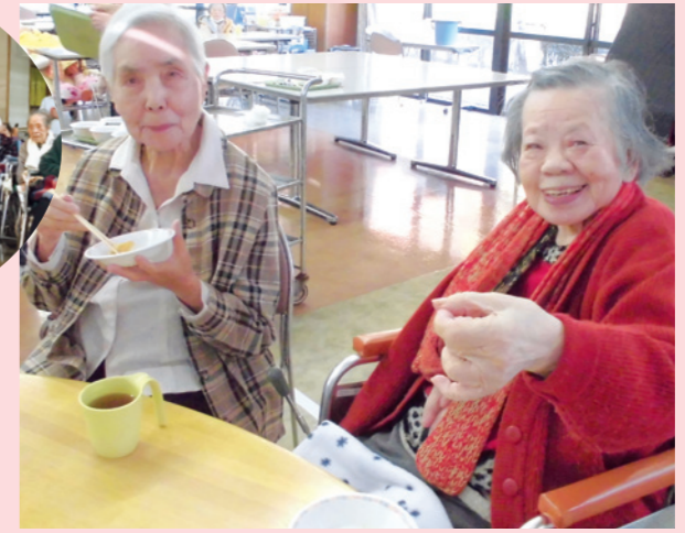
▲つきたてのお餅に皆さんご満悦でした