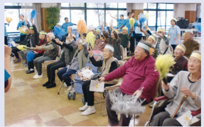
▲ワンツー！ワンツー！

利用者の皆さんは口々に「また 来てね！」と声を掛けていま した。学生の皆さんの心のこも った、とても気持ちのよい音楽療 法でした。