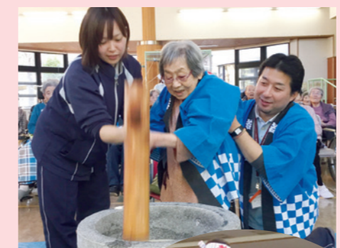
▲102歳の方の つき初め！

今年も「もちつき大会」を盛大に行いました！！ 最初は102歳の方に つき初めを、最後は苑長 がつきしめを行い、見事 完成いたしました。 つきたてのお餅とおは ぎを召し上がっていただ きました。 皆さま大変喜ばれ、い よいよ新年を迎える準 備が始まったと感じまし た。