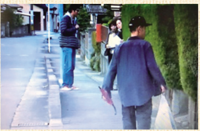
まちを歩く徘徊者役

芥見東・南地域を搜索対象に、徘徊搜索模擬訓練(地域包括支援センター・東部主催)が行われ、大洞岐協苑からもサポーターなどで5名が参加しました。 地域のみなさんがとてもあたたかく、丁寧に接する姿が印象的でした。