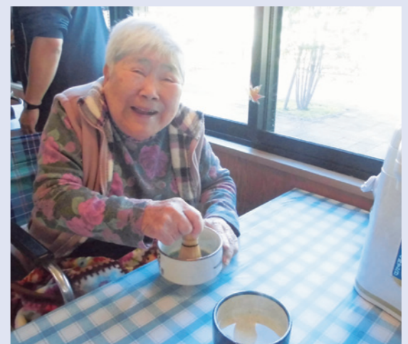
▲お供のお抹茶を立てていただきました。