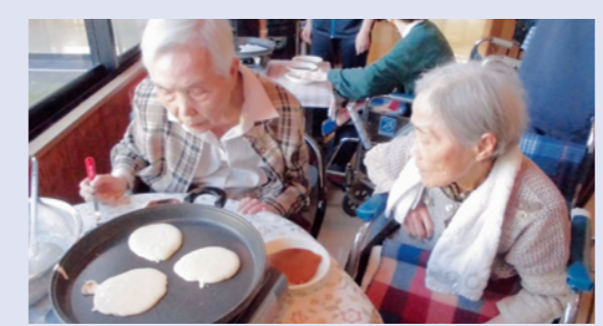
▲生地を見つめる目も真剣です！

皆さまが楽しみにしてい る、おやつ時間。 本日は、どら焼きを作り ました。アツアツのホット プレートで生地を焼き、ホ クホクの餡をたっぷりはさ みました。もうひとつのお 楽しみはお抹茶です。茶せ んでくるくる、いい香り！ 皆さん美味しそうに召し上 がってみえました！！