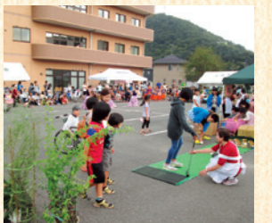
ヒーノンと募金活動しました。