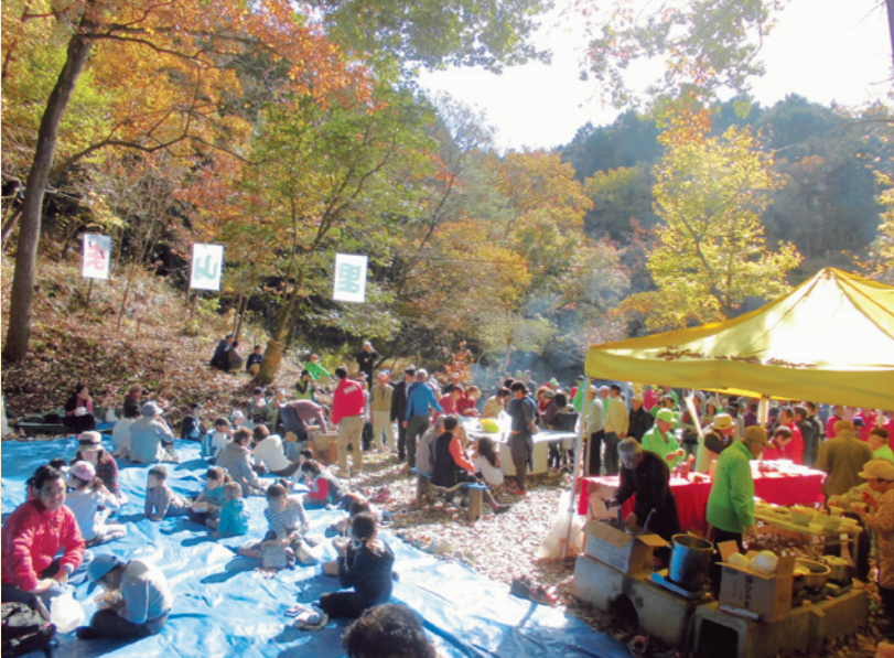
たくさんの地域の方で賑わいました！

大洞地区の里山つくり会主催の「大洞里山まつり」が開催されました。トランペット演奏があり、素敵な音色が里山に響きわたりました。会場にはいくつかの模擬店が並び、もちつき大会も行われました。大洞岐協苑も毎年参加しており、お餅入りぜんざいは大洞岐協苑の名物となっています。