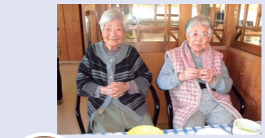
▲美味しい！！おかわり待ちです。