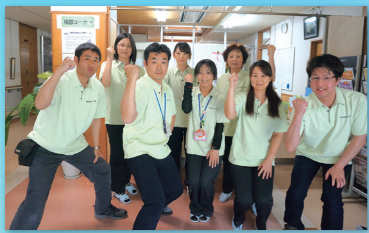
▲ビジョン発表会後は、各事業所にてビジョンテーマと目標、具体策について周知会を行いました。