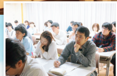
▲職員も真剣に聞き入っていました。

チームの目標を明確にすることで、どんな仕事をすべきなのかははっきり見えました。また、岐協福祉会の一員として、私たち一人ひとりが目標に向かって行動し、大きな目標を達成することが大切だと感じました。強い意志でやり遂げていきたいと思えます。